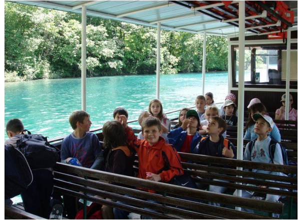
Prizori s izleta četvrtih razreda na Plitvička jezera